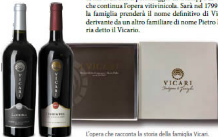
L'opera che racconta la storia della famiglia Vicari.

La storia della famiglia risalta di nuovo alla ribalta nel 1726 con il personaggio di Giuseppe di Vico che continua l'opera vitivinicola. Sarà nel 1799 che la famiglia prenderà il nome definitivo di Vicari derivante da un altro familiare di nome Pietro Maria detto il Vicario.